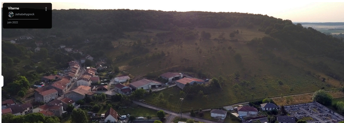
Vue aérienne de la ferme et du parc attenant

Après avoir posé nos valises et défait nos cartons, il est temps pour nous de se remonter les manches et proposer aux Viternois et Viternoises , un lieu de vie radieux 🌞