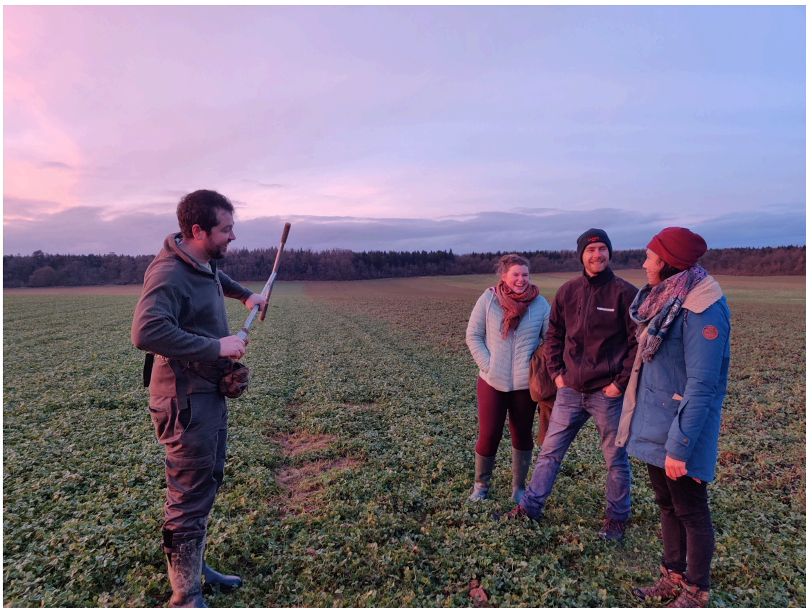
Carottage en cours, toujours dans la bonne humeur !

Le choix d'une parcelle a été confirmé par notre expert, plus qu'à trouver de l'eau ! 💧