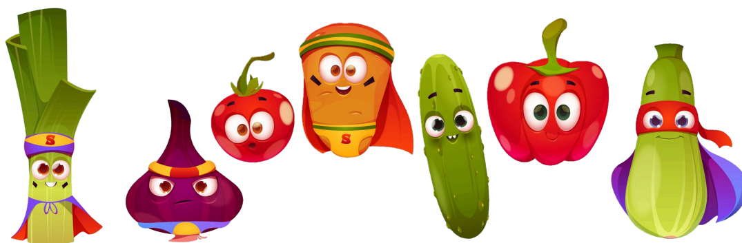
Image de Supers Légumes

La première saison de la série « De Supers Légumes à LUTHOPIE » 🎬 verra comme actrices une vingtaine d'espèces de légumes aussi variées qu'attendues ! 😊